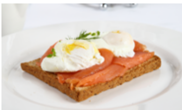
Con salmone norvegese affumicato With Norwegian smoked salmon KD. 4.750