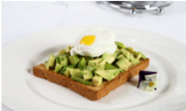
UOVO IN CAMICIA Poached egg

Con avocado su crostone di pane integrale With avocado on toasted wheat bread KD. 4.150