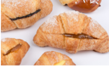
CROISSANT KD. 2.250

Breakfast at Cova fino alle / until 12:00