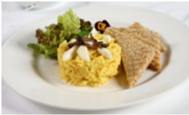
UOVA STRAPAZZATE CON TARTUFO NERO E FROMAGGIO Scrambled eggs with black truffle and cheese KD. 4.150