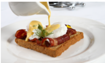
Con bacon di manzo With beef bacon KD. 4.150

Con avocado su crostone di pane integrale With avocado on toasted wheat bread KD. 4.150